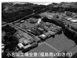
小名浜工場全景(福島県いわき市)